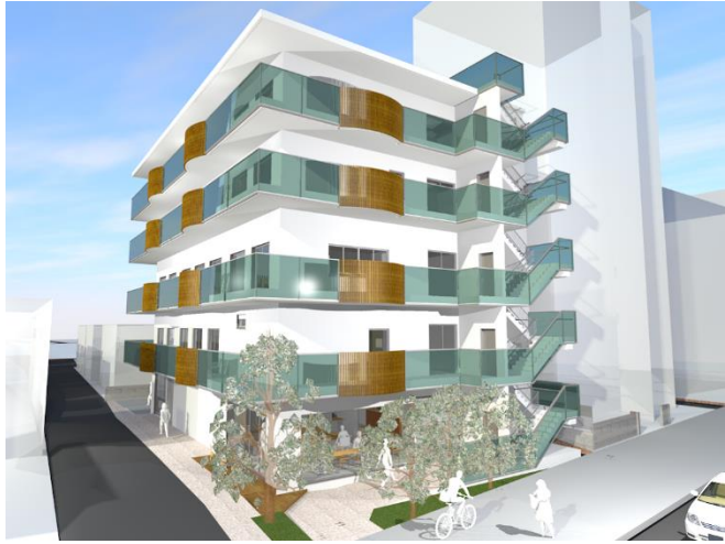
(甲州街道側外観 予定図)